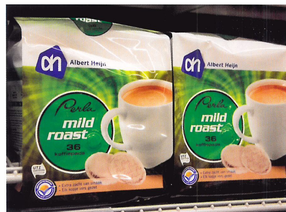
Afb. 1.14 Een huismerk, bijvoorbeeld van Albert Heijn, is een B-merk.

Een B-merk is een merk dat minder bekend is, bijvoorbeeld een huismerk. De kwaliteit hoeft niet per se minder te zijn dan van een A-merk. Een B-merk is vaak wel goedkoper dan een A-merk. B-merken worden in minder verschillende winkels verkocht. Bijvoorbeeld: cola. Het A-merk is Coca Cola en het B-merk is de cola van het huismerk Albert Heijn of Plus.