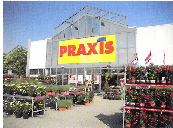
Afb. 1.12 Praxis verkoopt niet alleen materialen om te klussen. Ook planten horen tegenwoordig tot het assortiment van Praxis.

Alle producten in een winkel vormen samen het assortiment van de winkel. De ondernemer kan beslissen of hij een breed of een smal assortiment wil hebben.